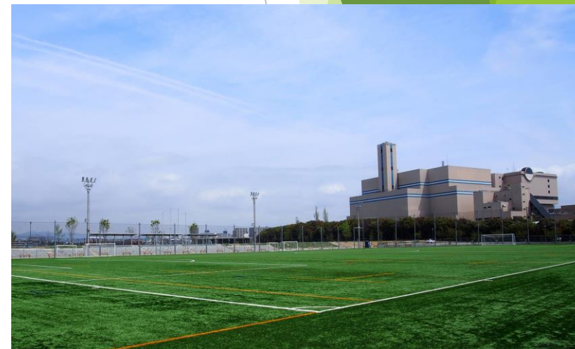
西宮浜多目的人工芝グラウンド